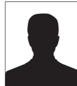
... und Gäste (Überraschung)