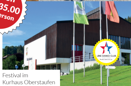
Festival im Kurhaus Oberstaufen

Ob Line Dance, Wandern oder Wellness, diese Tage werden für dich ein ganz besonderes Erlebnis sein. Die einmalige Kombination aus Line Dance, Tradition und Lifestyle sorgt für eine erfrischende Abwechslung.